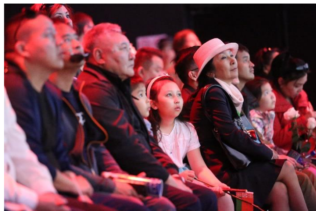
ZONE II 観覧する来場者