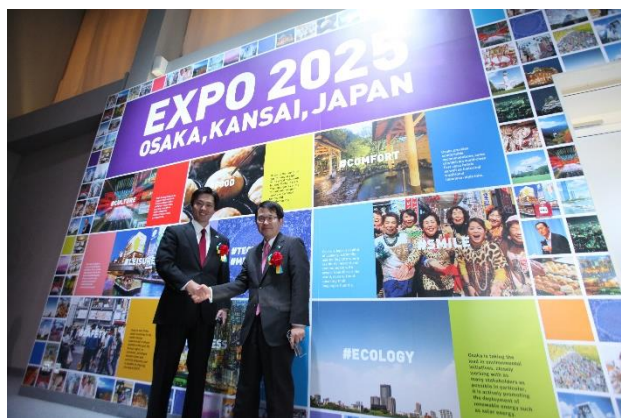
ZONE III 大阪博誘致コーナー