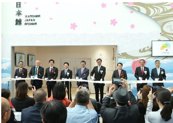
<日本館 開館式の様子>

日本館開館初日の来館者数はおよそ6,000名で、来場者がひっきりなしに入館するほどの盛況でした。