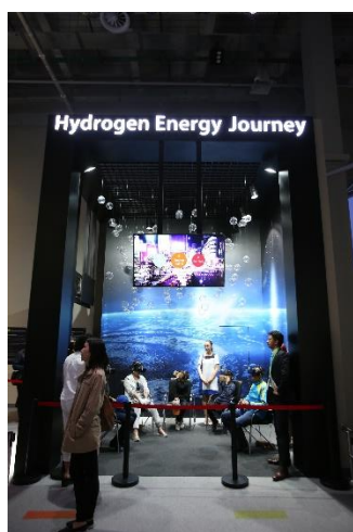
ZONE III 水素をテーマとしたVRアトラクション