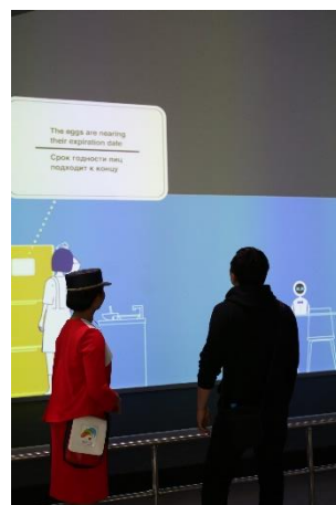
ZONE III 暮らしのテクノロジー