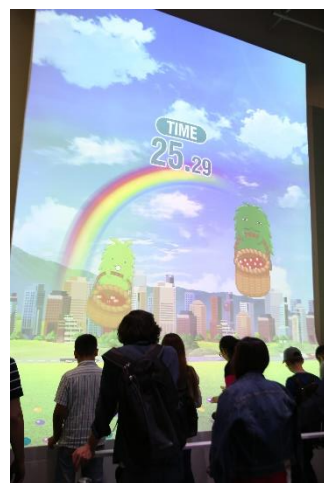
ZONE III CO2削減ゲーム