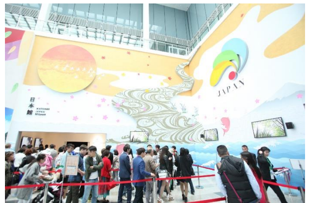
<日本館 一般向けオープンの様子>

アスタナ万博は、「未来のエネルギー」をテーマに、2017年6月10日(土)から9月10日(日)の93日間にわたってカザフスタンの首都・アスタナで開催されます。日本館では、「Smart Mix with Technology ～オールジャパンの経験と挑戦～」をテーマに、エネルギー課題に対する日本の取り組みや、日本の高い技術力と世界の課題解決に貢献できる日本の姿を世界に向けて発信します。また、2025年国際博覧会の大阪誘致に向けたPRを行います。