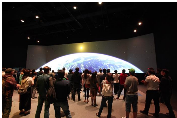
ZONE II ジャパンプレゼンテーション